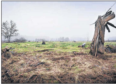
Bomenkap voor de oude Maasarm.

H et geldt als een landelijk voorbeeldproject, maar de begroting wilde maar niet sluiten. Ooijen-Wanssum. Een oude Maasarm in het gebied moet heropend worden zodat de Maas bij hoogwater meer ruimte krijgt. Dit werk wordt gecombineerd met wat in ambtelijke taal 'gebiedsontwikkeling' is gaan heten. Kort gezegd: er wordt meteen een nieuwe haven aangelegd, woningbouw gepland, een randweg gemaakt en natuur ontwikkeld.