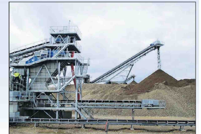
Er wordt bijna een half miljoen ton extra grind gewonnen.

Het uitvoerend Consortium Grensmaas - een samenwerking tussen grindbedrijven, aannemers en de Vereniging Natuurmonumenten - zit in zwaar weer. Het lijdt tientallen miljoenen euro's verlies op het project door de slechte grindmarkt. Ter compensatie voor allerlei meerwerk trekt het rijk nu de beurs: 34 miljoen euro en een mogelijkheid tot lening van 40 miljoen. Verder wordt dertig tot veertig miljoen euro bespaard op de uitvoering. Bijvoorbeeld door de ontgrinding van elf