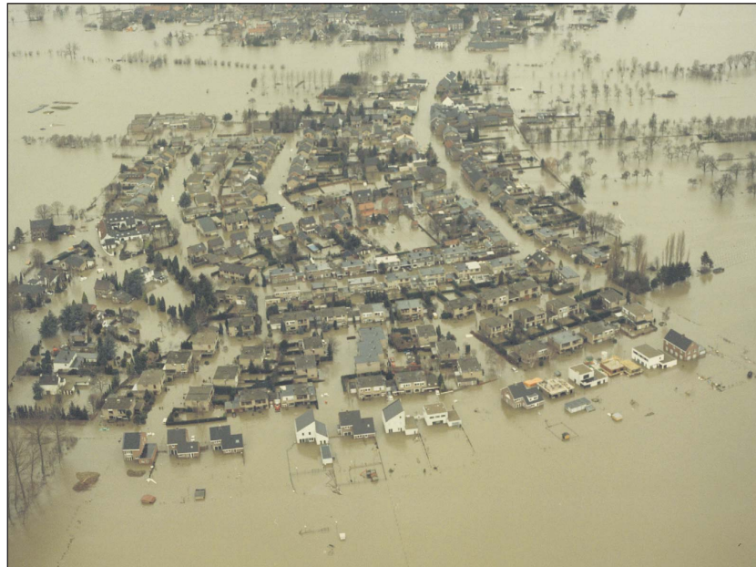
Beelden die bijna iedere Limburger kent: een compleet ondergelopen litten bij de watersnoodramp in 1993.