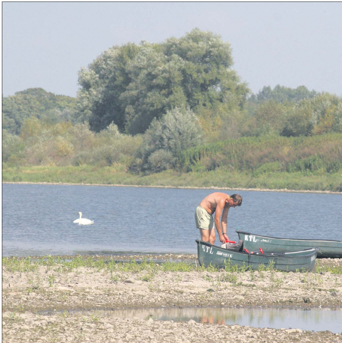
De Dwaalfilm Maasvallei laat niet alleen de natuurlijke rijkdom zien van de Grensmaas tussen de beide Limburgen, maar legt ook de toeristische (en economische) potentie bloot.

Dwaalfilm Maasvallei . Gisteren officieel in première gegaan in het Filmhuis Sittard, vandaag door iedereen gratis binnen te halen. Een virtuele wandeling langs de Grensmaas, van Borgharen en Itteren tot Obbicht en Neerkant. Een wandeling vanuit je luie stoel langs konikpaarden en wilgenbossen, door bloemrijke grindvlakten, langs kraamkamers voor vissen, maar ook een wandeling