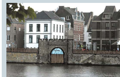
Het waterpoortje in Wyck achter glas.